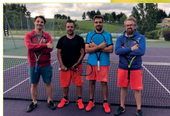
L'équipe championne du Tennis Club Les Villettes / Saint Maurice.