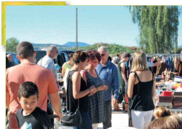
Vide-greniers proposé par "Villettes en Fêtes".