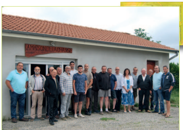
Assemblée générale de l'association communale de chasse.