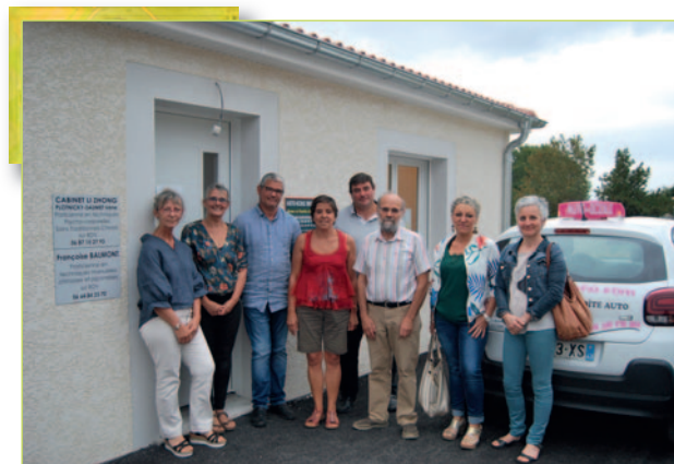
Inauguration de l'auto-école et des cabinets de médecine douce.