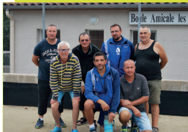
Concours de la Boule Amicale en août dernier.