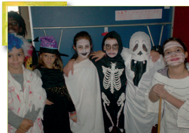
Halloween à l'accueil de loisirs Oxygène.