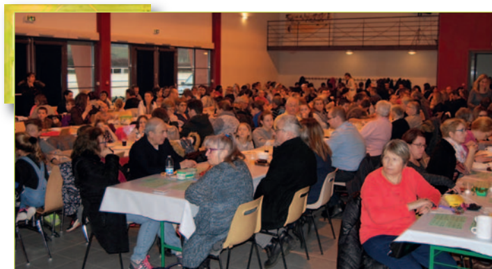
Loto de l'école privée.