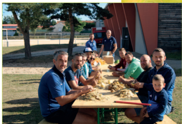
Préparation de la soupe aux choux de l'A.S.V.