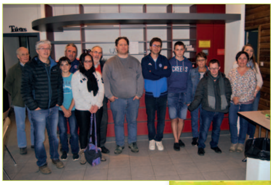
Marche "Arc en Ciel".