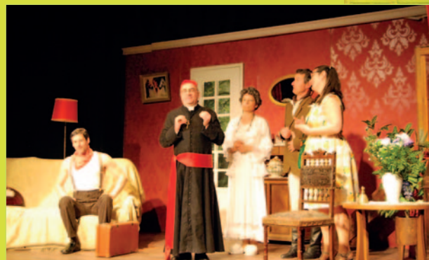
Théâtre de Pâques.